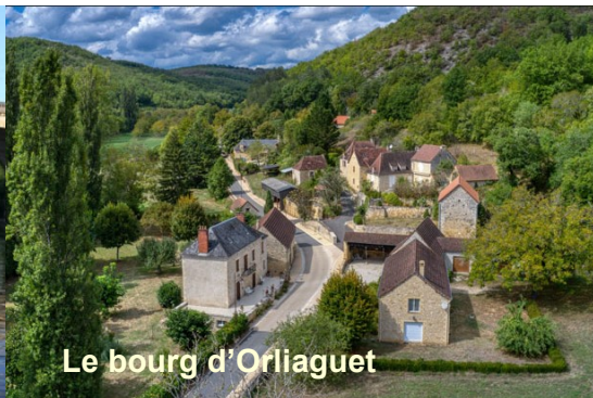
Le bourg d'Orliaguet