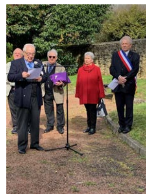
Les membres de la FNACA