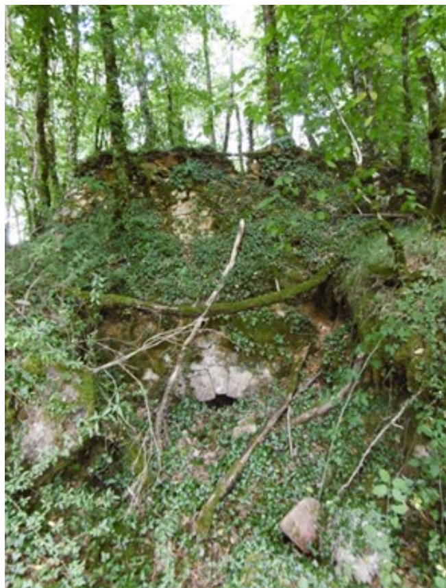
La tuilerie / briqueterie du Lac Rouge Vue côté alandier

Également la restauration de la fontaine Saint-Martin serait à envisager pour lui redonner sa forme primitive, la fontaine de la Combe de Lafon, la fontaine Fontqueyrade et deux cabanes en pierres sèches dont une est en partie effondrée. Ces restaurations seraient également à réaliser sur les autres communes avec les croix de chemin et de hameaux.