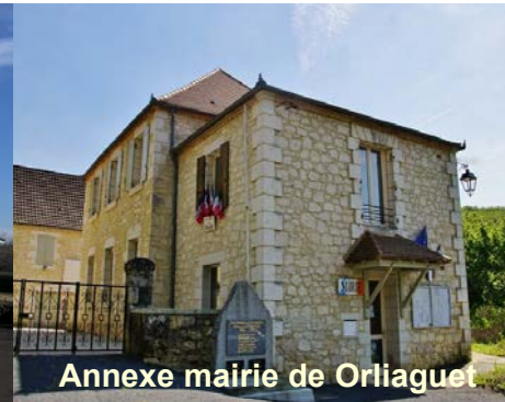
Annexe mairie de Orliaguet