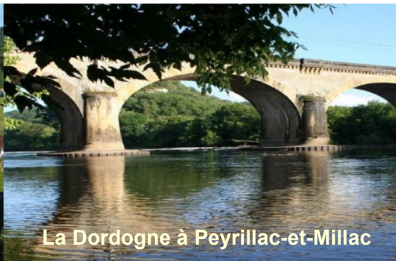
La Dordogne à Peyrillac-et-Millac