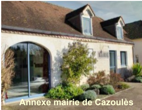
Annexe mairie de Cazoulès