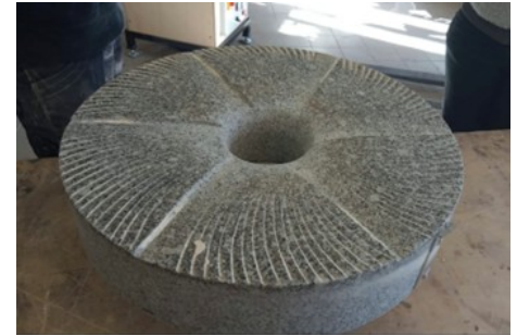
Meule en pierre