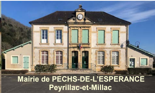
Mairie de PECHS-DE-L'ESPERANCE Peyrillac-et-Millac