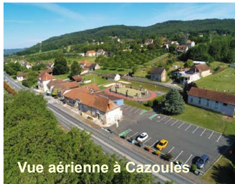
Vue aérienne à Cazoulès